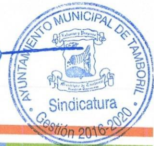
RELACION DE COMPRAS PERTENECIENTE AL MES DE NOVIEMBRE 2019